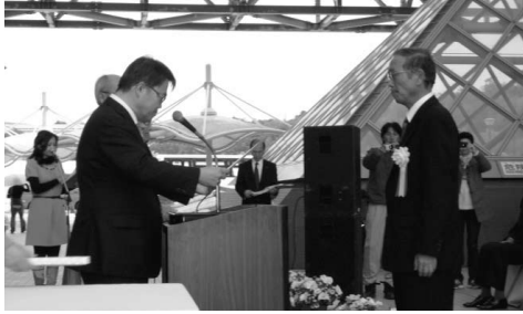
問合せ先 消防署 自主防災担当 ☎68♦5110

日ごろから防災活動に積極的に取り組み地域防災力の向上に貢献していることが認められたものです。その他、県内6団体が表彰されました。