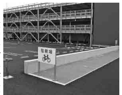
ポートルース蒲郡の駐輪場