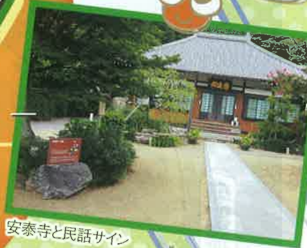
安泰寺と民話サイン

完歩賞として、「にしがま線応援団特製クリアファイル」を進呈します。(要エントリーあり)