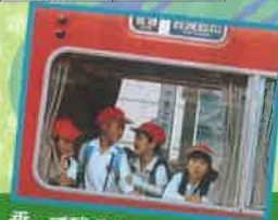
乗って残そうにしがま線!