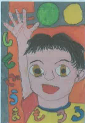
愛知県交通安全協会蒲郡支部長賞