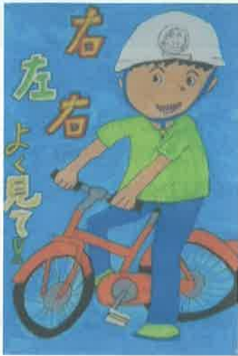
蒲郡市交通安全都市推進協議会長(蒲郡市長)賞