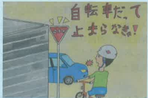
愛知県蒲郡警察署長賞