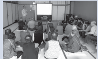
出前講座の様子。医療現場のスタッフが直接皆さんに病気や病院のことをお話します。

際に治療や療養生活を支えているのかを理解してもらうことで安心した医療が提供できると考えています。