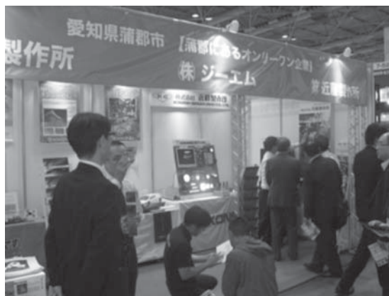
昨年の会場内の様子