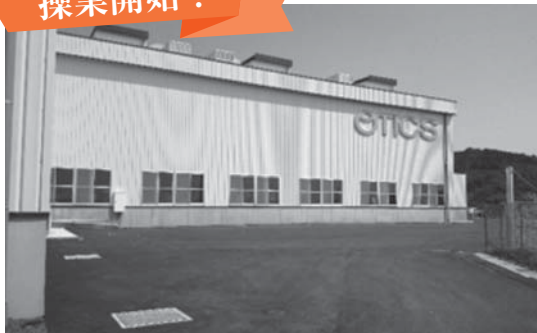
6月に操業する蒲郡工場