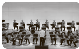
文化賞 蒲郡市シニア吹奏楽団 (洋楽)