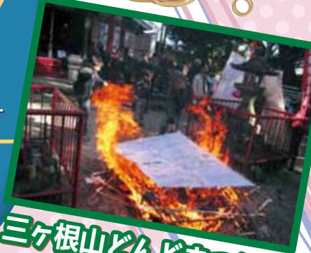
三ヶ根山どんどもまつり 会場・三ヶ根観音 11:00~