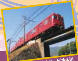
乗って残そうにしがま線!

名鉄蒲郡線 吉良吉田 三河鳥羽 西幡豆 東幡豆 こどもの国 西浦 形原 三河鹿島 蒲郡競艇場前 蒲郡