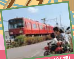
乗って残そうにしがまし線!

名鉄蒲郡線 吉良吉田 三河鳥羽 西幡豆 東幡豆 こどもの国 西浦 形原 三河鹿島 蒲郡競艇場前 蒲郡