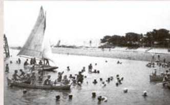
春日浦海水浴場(昭和20年代)