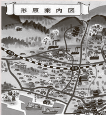
形原案内図(昭和30年代)