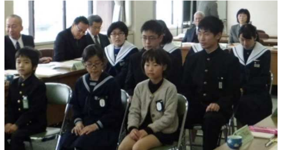
蒲郡教育奨励賞の受賞者のみなさん