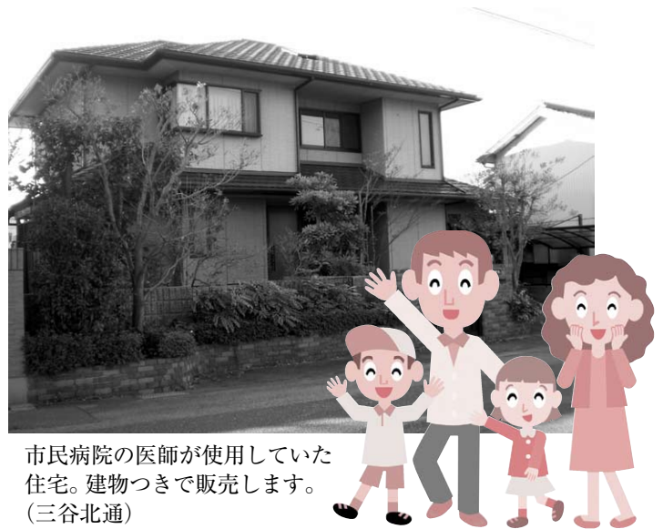
市民病院の医師が使用していた住宅。建物つきで販売します。(三谷北通)

自己の建物および構築物を建設しようとする個人または法人。なお、未成年者、成年被後見人、被保佐人、被補助人ならびに破産者で復権していない方、営利を目的として売買しようとする方および税の滞納のある方は申し込みできません。