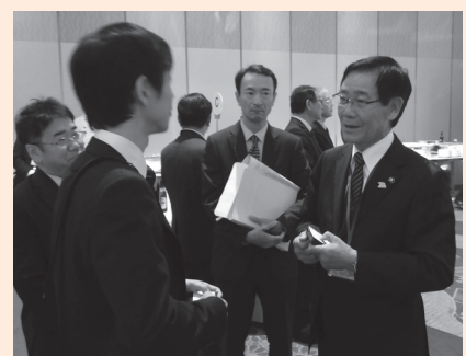
昨年11月に行われた市長トップセールスの様子

東京・大阪で行われる企業向けセミナーに市長が出向き、市長自ら市の魅力を積極的にPRしています。