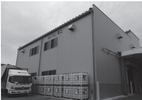
昨年増設の行われた工場

市では、工場立地の際に必要な開発許可に関するサポートや、設備投資に関する補助金などの優遇制度の相談を受け付けています。市内に長年立地している製造業の企業が工場や研究所を新增設する際、県と連携し対象経費の10%を補助します。昨年度は工場の増設を行った企業1社に補助金を交付し、今年度も工場の新增設を行う2社に交付する予定です。