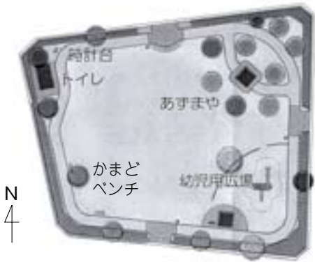
ワークショップで計画した本町公園のモデル案