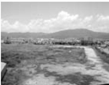
暫定的な活用策として多目的広場が整備される東港埋立地