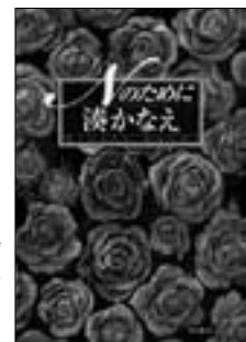
『Nのために』 湊 かなえ／著 東京創元社

瀬戸内の島の東屋 あずまや で、ビルの窓掃除のゴンドラの上で、古いアパートの一室で、わたしは「N」を守ることを決意した…。悲劇的な殺人事件の真相を、モノローグ形式で解き明かす連作長編。『ミステリーズ！』連載を単行本化。