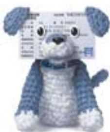
国民健康保険のマスコット 「こくほ犬」

収入がなかった方、非課税年金(障害基礎年金・遺族年金など)を受けている方など、所得税または市県民税申告の必要のない方は、4月15日(木)までに国民健康保険税の所得申告をしてください。