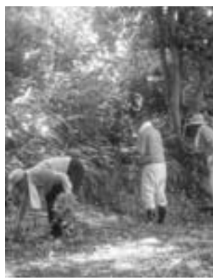
整備が予定される大塚町橋丘