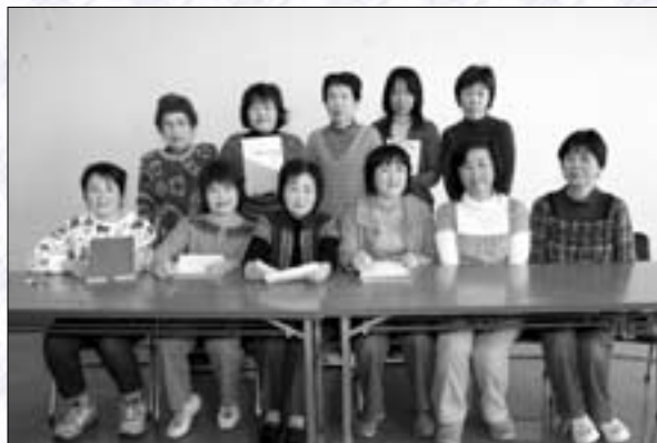
点訳グループ「あい」

広報がまごおりを朗読し、毎月テープに吹き込んだものを、視覚障がい者に送付しています。