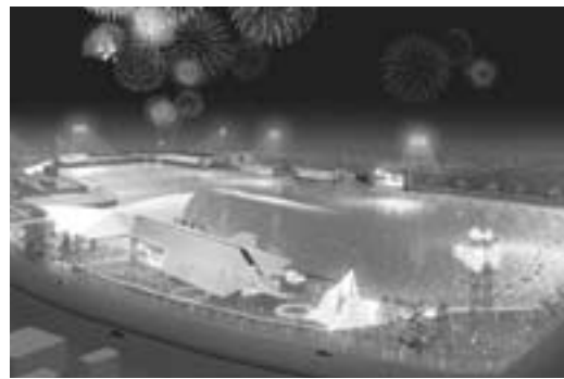
平成23年度から施設改修を予定している蒲郡競艇場(イメージ図)