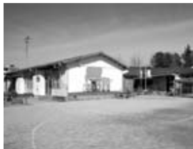
改修を予定している南部保育園