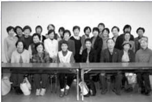
蒲郡朗読ボランティアグループ「声」

広報がまごおりを朗読し、毎月テープに吹き込んだものを、視覚障がい者に送付しています。