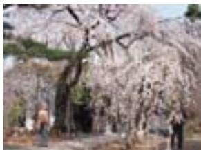
専称寺のしだれ桜