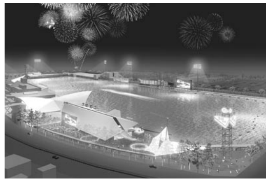
平成23年度から施設改修を予定している蒲郡競艇場(イメージ図)