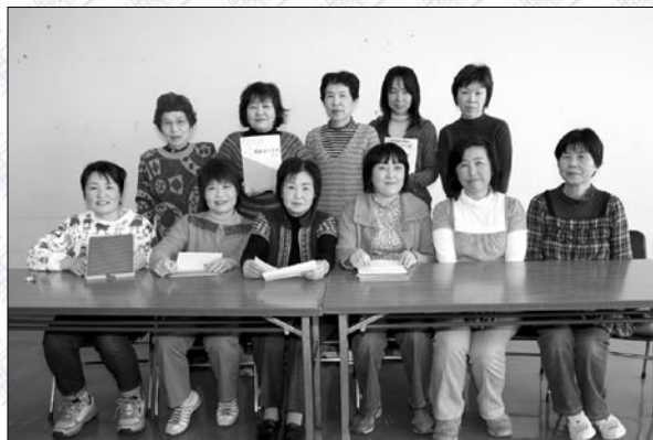
点訳グループ「あい」

広報がまごおりを朗読し、毎月テープに吹き込んだものを、視覚障がい者に送付しています。