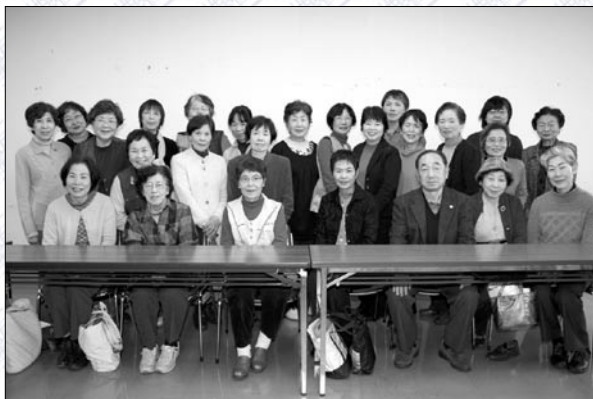
蒲郡朗読ボランティアグループ「声」

広報がまごおりを朗読し、毎月テープに吹き込んだものを、視覚障がい者に送付しています。