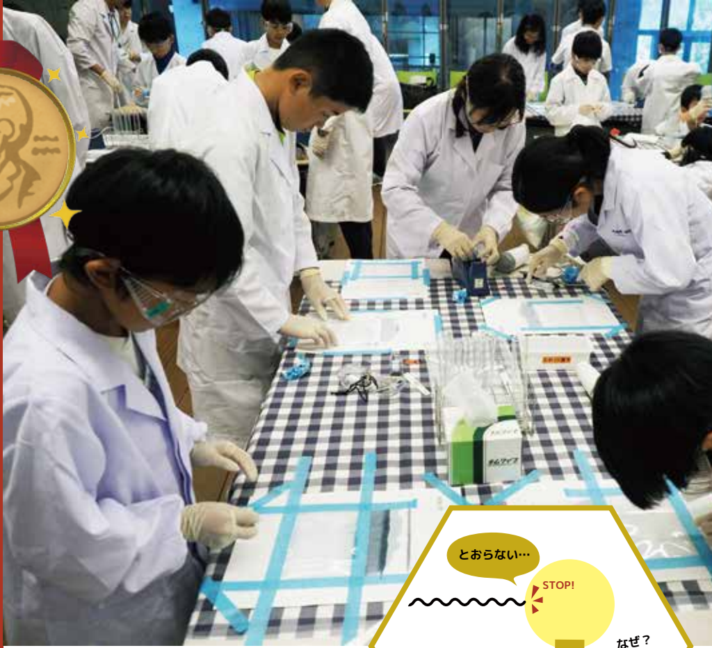
ソニー教育財団「科学の泉-子ども夢教室」での実験教室