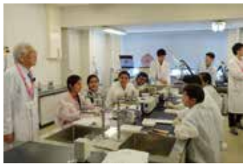
JSTさくらサイエンスハイスクールプログラムの実験教室 (芝浦工業大学で実施)