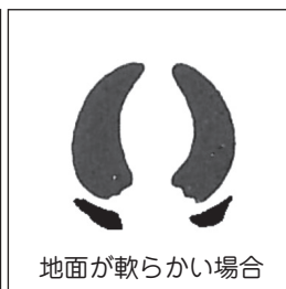
地面が軟らかい場合