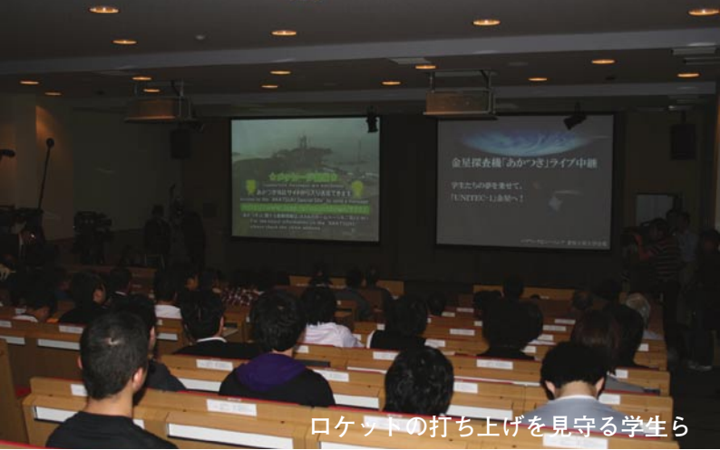
ロケット下の打ち上げを見守る学生ら