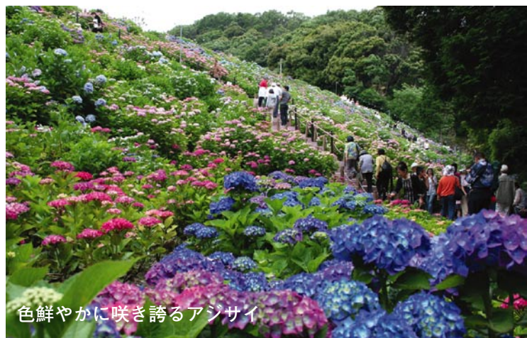
色鮮やかに咲き誇るアジサイ

あじさい祭りの期間中は、夜間のライトアップも行われ、会場近くでは、ゲンジボタルが舞う姿も見られるなど、さまざまな光の競演によるロマンチックな光景も鑑賞できます。