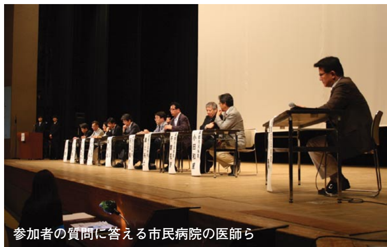
参加者の質問に答える市民病院の医師ら