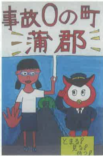
蒲郡市交通安全都市推進協議会長(蒲郡市長)賞