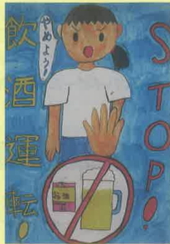
愛知県蒲郡警察署長賞