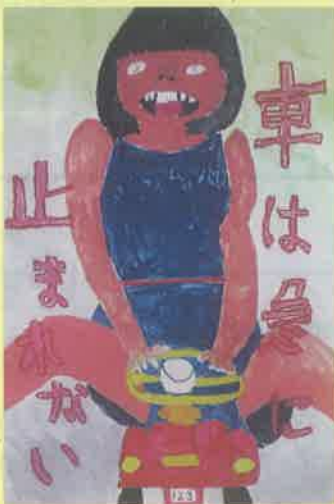
愛知県交通安全協会蒲郡支部長賞