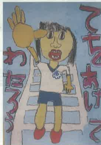
蒲郡市教育委員会賞