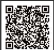
科学館ホームページ