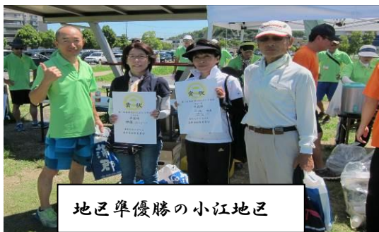
地区準優勝の小江地区

スコアーは別に大会参加者全員が暑い中、楽しんで交流を深めました。今後第2回、3回と大会規模を大きくして、蒲郡市内だけでなく市外からの参加者も増やして、交流を深めていけたら良いと思いました。