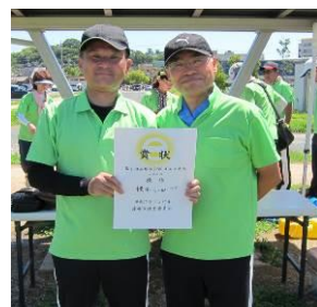
ペア・地区優勝の東部地区

チーム編成は2人1組のペアになり、全9ホール（Par36）でペアの2人で交互に1つのボールを打ち合ってトータルスコアを競うルールで行いました。