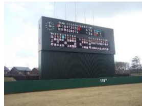
<改修スコアボード（イメージ）>