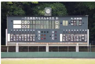
<現在のスコアボード>

スコアボード電光掲示板化改修工事 内野グラウンド整備 防球フェンス・壁面セーフティウォール更新 等