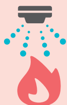
スプリンクラー設備