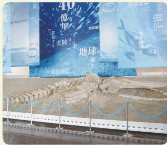
開館当初から展示されているクジラ化石。平成28年に新属新種「インカクジラ」と命名されました。

「小学生の時よく家族と来ていました。将来は科学とか宇宙に関する仕事がしたいと思って。」と職場体験に来てくれた中学生。互に、友達とよくパソコン使いに科学館に来てました。ついでに化石触ったり、展示室で映画見たりね。」と、小さなお子さん連れの若いお父さん。「子どもの手が離れたからまた来たのよ、ようやく自分のペースで見られるから」と、平日に連れ立って来た女性の皆さん。数年前、進路に悩んでいた女子高生は、「私が研究している燃料を使った口ケットが、10年後には宇宙に打