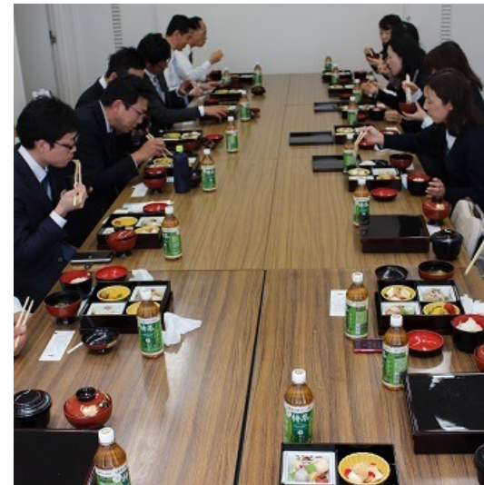
ヘルシーメニュー弁当のランチ会