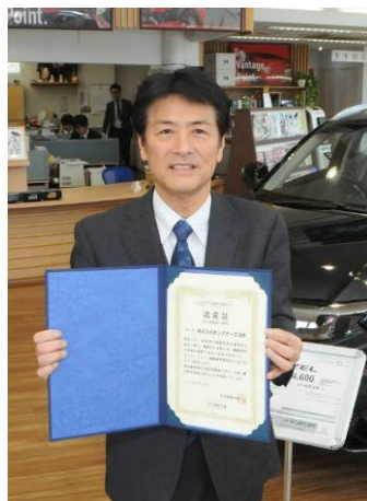
健康経営優良法人 2018新規認定 (中小規模法人部門) (株)ホンダカーズ蒲郡