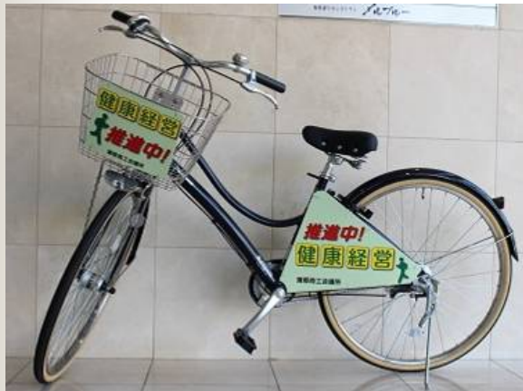
近隣事業所への訪問は自転車で