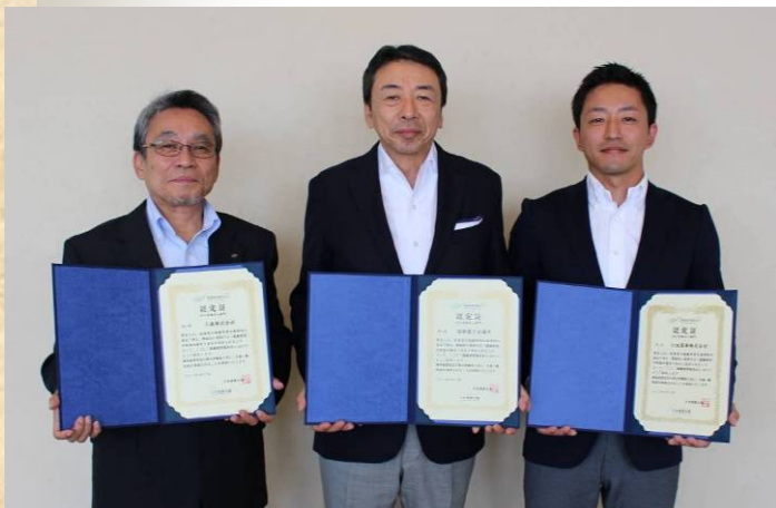
健康経営優良法人 2017認定 (中小規模法人部門) (左から小森株、 蒲郡商工会議所、 小池商事株)

職員8名が健康経営アドバイザー資格を取得。「健康宣言」、「健康経営優良法人認定申請」に伴う申請手続きや必要な取り組み等の相談に対応。