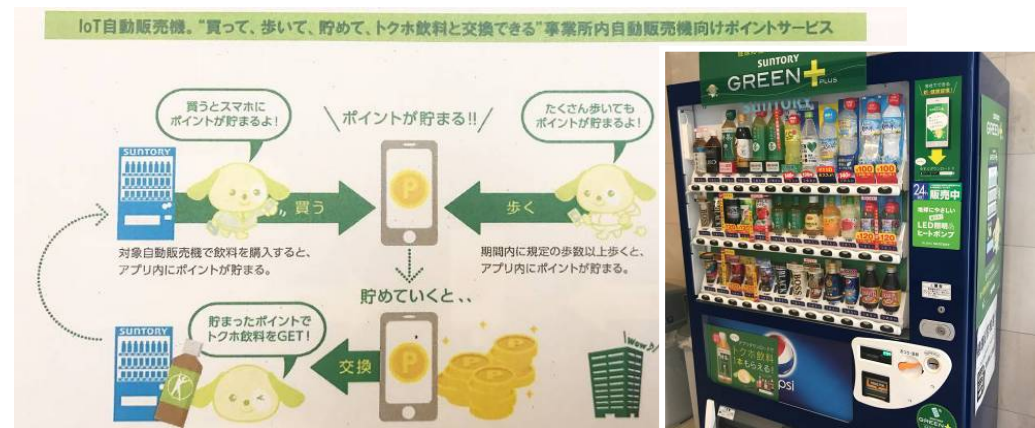
歩いてポイントが貯まるトクホ充実の自販機