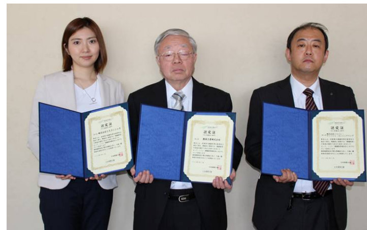
健康経営優良法人 2019新規認定 (中小規模法人部門) (左から(株)ミスコンシャス、 艶栄工業株、 (株)ジャパン・ティッシュ・エンジニアリング)