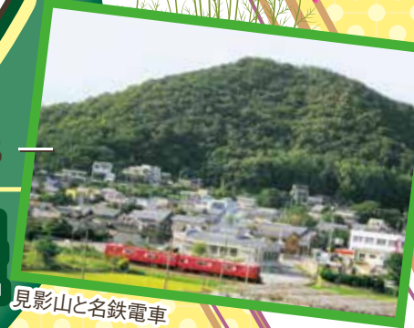
見影山と名鉄電車