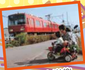
乗って残そうにしがま線!