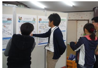
オープンハウスのイメージ