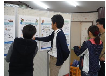
オープンハウスのイメージ