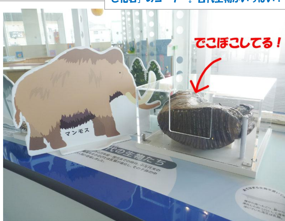
マンモスの歯の形は、人間とぜんぜんちがう!

その中で、ひときわ大きくめだっているのが、 マンモスの歯(キバじゃなくて、奥歯です)の化石です。人間の歯とは、かたちがぜんぜんちがいます。かみ合わせの部分は、シマシマもようのデコボコになっています。