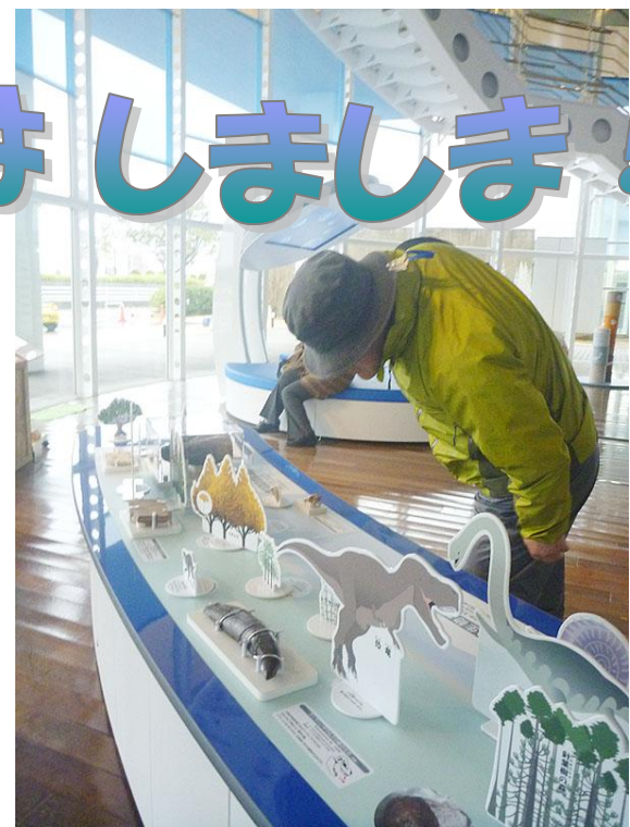
一階に新しく登場した「生物のうつりかわりと化石」のコーナー。古代生物がいっぱい!

一階に、新しいあそびが、たくさんふえました! 「生物のうつりかわりと化石」のコーナーでは、 アンモナイトや三葉虫などのホンモノの化石にさわったり、恐竜やシーラカンス、クビナガリュウのクイズにもチャレンジ!できます。