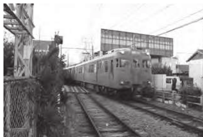
乗って残そう名鉄西尾・蒲郡線