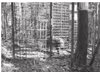
捕獲されたイノシシ