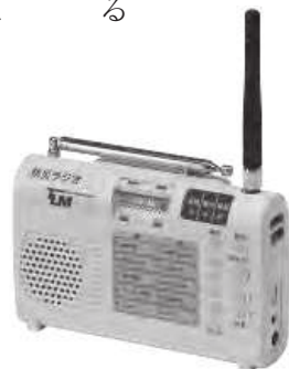
280MHz デジタル同報無線防災ラジオ