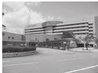
地域医療を支える市民病院