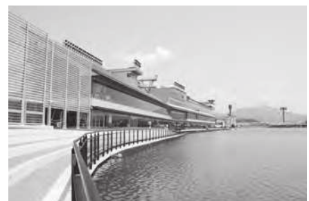
ポートルース蒲郡