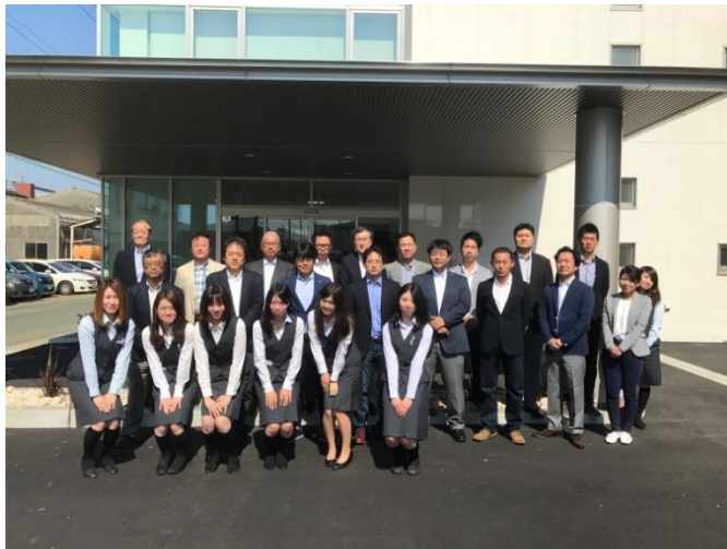
職場を快適な環境にするため建て替えを実施（2017年）