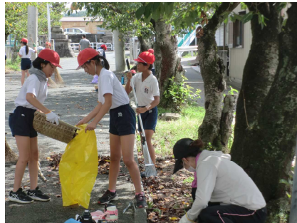
形原小:9月11日(金) 御嶽神社

清掃場所もとってもきれいになりました。活躍する子どもたちに、「ご苦労様」「がんばってね」と声をかけると、「ありがとうございます」「がんばります」と、純な言葉が返ってきて、思わずうれしくなりました。