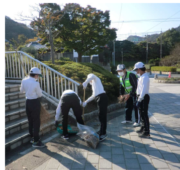
形原北小:11月12日(木) 双田山公園、北浜公園、アジサイの里