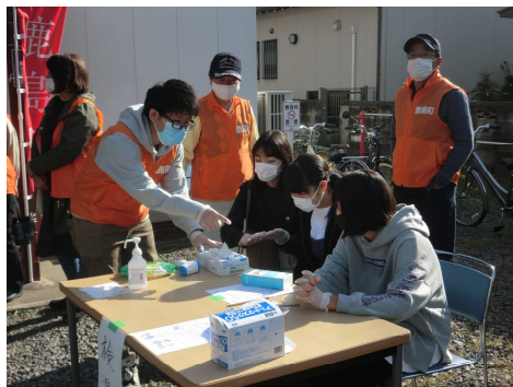
11月1日(日)鹿島集会所

小学生の子らは、家族と共に集会所に避難してきて、地域の方と触れ合いながら避難訓練を体験できました。