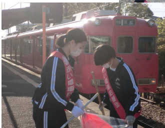
11月25日 西浦小学校 竜田海岸清掃