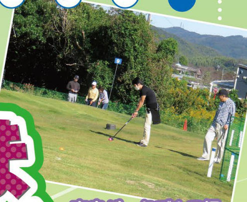
吉良パークゴルフ場