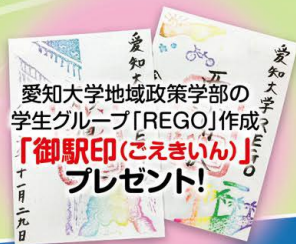
愛知大学地域政策学部の学生グループ「REGO」作成 「御駅印(ごえきいん)」プレゼント!