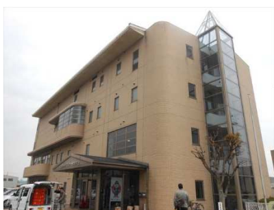
生きがいセンター