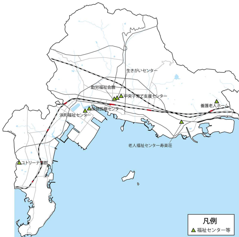
図 3-68 配置状況・外観写真（保健・福祉施設）