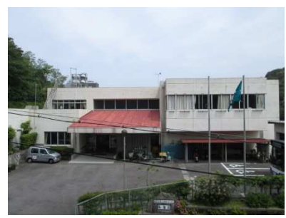
老人福祉センター寿楽荘