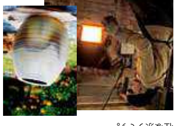
16 玄楼薬 三河鳥羽駅1200m徒歩15分 ◎0563-62-2670 ◎不定休 半地下式穴窯を備え、備前焼や地元の上質の土を使った幡豆焼に挑む窯元。幡豆焼は金庫のなまきを持つきれいな焼物です。陶芸体験教室も開催されています(要予約)。