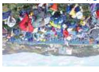
6 潮干狩り(吉田海岸) 吉良吉田駅900m徒歩11分 3月から6月まで、梶島、宮崎東海岸、吉田海岸の3か所で潮干狩りを楽しめます。できます。