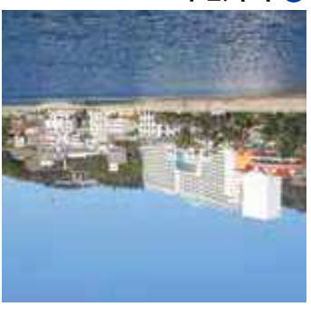
10 吉良温泉 三河鳥羽駅2600m徒歩33分 吉良の最南端に位置し、美しい三河湾を眺望できる宿泊・リゾート施設が並んでいます。