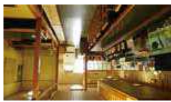
5 お食事処 永月 吉良吉田駅400m徒歩5分 ◎080-6984-0802 ◎月曜・火曜定休 地元産の新鮮な食材を使った料理が自慢です。少人数向けの個室の座敷席から最大45人まで入れる舞台付き宴会場まであります。