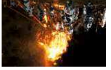
15 鳥羽の火祭り(鳥羽神明社) 三河鳥羽駅1000m徒歩13分 文化財である「鳥羽の火祭り」は、鳥羽神明社にて毎年2月2日曜日に行われています。燃え盛る火の中に飛び込んでいっ勝負な祭りです。