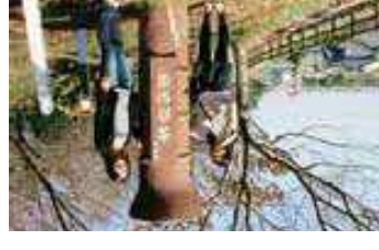
7 正法寺古墳 吉良吉田駅2200m徒歩28分 正法寺古墳は、墳長約9.4mの西三河地最大の前方後円墳。古墳周辺は公園として整備されており、保存状態の良好な墳丘を観察することができます。