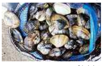
14 潮干狩り(西幡豆海岸) 三河鳥羽駅400m徒歩5分 ◎0563-62-2176(幡豆漁業協同組合) 3月から6月まで、西幡豆から鳥羽の海岸で、潮干狩りを楽しむことができます。