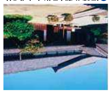
1 旧糟谷邸 (県指定文化財) 吉良吉田駅から徒歩23分 ◎休館日: 月曜(祝日を除く) 江戸時代から三河木綿などの商いで栄えた豪農豪商の糟谷家の屋敷を一部公開しています。