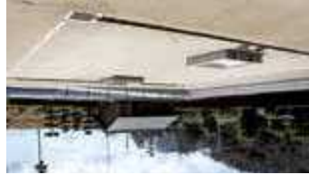
8 西尾市塩田体験館 吉良吉田駅2300m徒歩29分 ◎0563-32-3737 ◎休館日: 月曜(祝日を除く) 吉良饅頭塩の里は、昔ながらの塩田で太陽の熱と風の利用した塩づくり体験を随の熱と風との歴史と塩の製法を楽しむことができます。全国各地でも珍しい施設です。