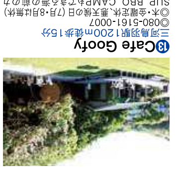
13 Cafe Goofy 三河鳥羽駅1200m徒歩15分 ◎080-5161-0007 ◎木・金曜定休。悪天候の日(7月・8月は無休)。SUP、BBQ、CAMPもできる海の前のカフェ。海から吹く風が感じられるテラス席がおすすめ。