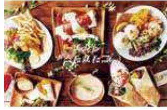
9 ニシオシヤイタナ 吉良吉田駅1800m徒歩23分 ◎0563-77-6901 ◎火曜定休 具材を巻いたフリトが看板メニュー。アメリカンスタイルのカフェ。トルティーヤでリフレッシュもおすすめ。