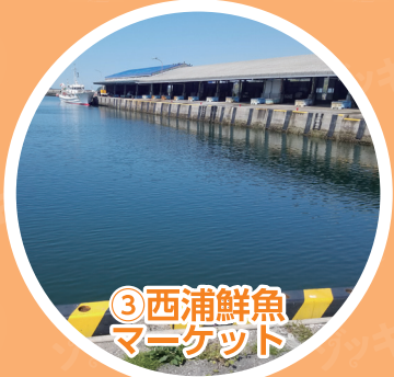
③ 西浦鮮魚マーケット