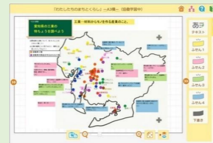
【画面の白地図に書き込む例】