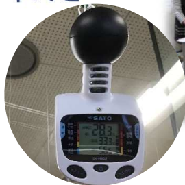
黒球型携帯熱中症計