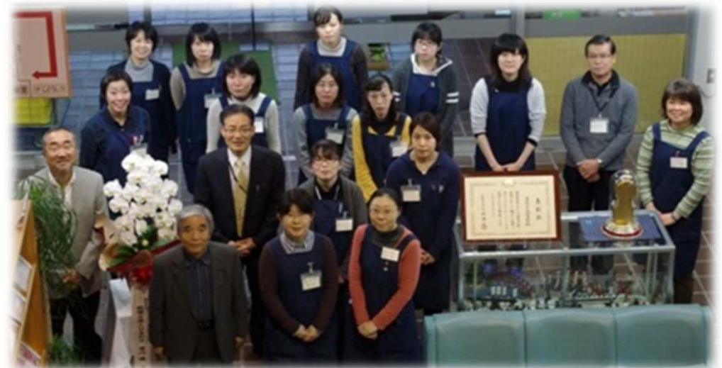
子どもの読書活動優秀実践図書館として文部科学大臣表彰 平成25年(2013)4月