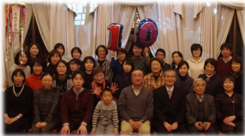
10周年のお祝い 平成29年(2017)11月29日

設立 平成19年(2007)11月 職員16人 パート職員23人 ボランティア 12人