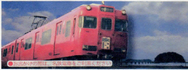
●お出かけの際は、名鉄電車をご利用ください