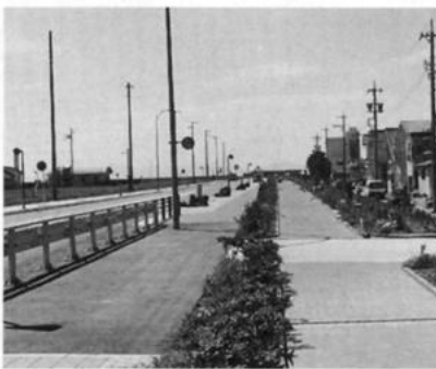
歩道も整備されています

・契約および登記に関する諸費用(売買契約の印紙税、登記に関する登録免許税等)は、買受者で負担していただきます。