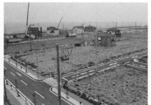
県営住宅から春日浦住宅地を見る