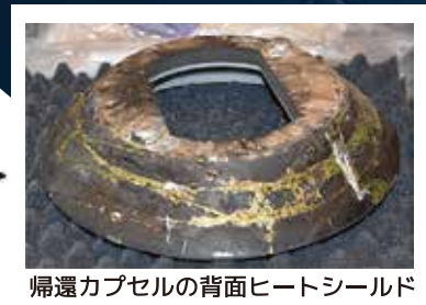
帰還カプセルの背面ヒートシールド