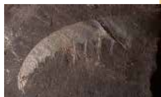
これがアノマロカリスの化石だよ！