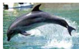
ほにゅうるい 哺乳類 (イルカ)