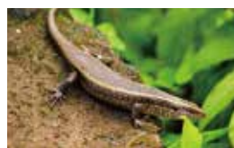
はちゅうるい 爬虫類 (トカゲ)