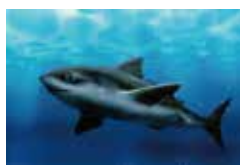
ぎょるい 魚類 (サメ)