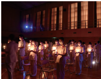
ソフィア看護専門学校戴灯式 (10月22日) 39人の生徒たちが、厳かな雰囲気の中でナイチンゲールの像から1人ずつ灯りを受け取り、思いやりの心で看護を行うことを誓いました。真っすぐに前を向く眼差しは輝きを増し力強く見えました。(凸)