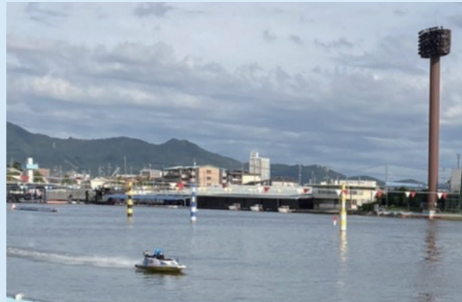
◀ ボートレースの大時計と参加者