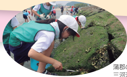
蒲郡の海を学ぶ 三河湾環境チャレンジ