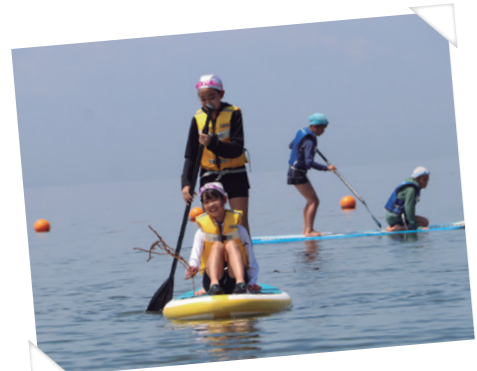
授業でSUP体験 in 西浦海岸