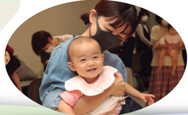
公民館で 親子リトミック教室