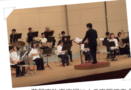
蒲郡市吹奏楽団による定期演奏会