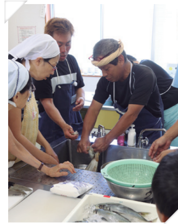
漁師が教える親子料理教室

一人ひとりの学びの成果が地域課題の解決やまちの活性化 に役立つものとなるよう、その仕組みづくりに取り組めます。 また、生涯学習が地域コミュニティの基盤となるまちづくり を進めます。