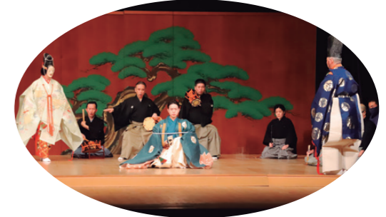
多彩な文化芸術にふれる機会