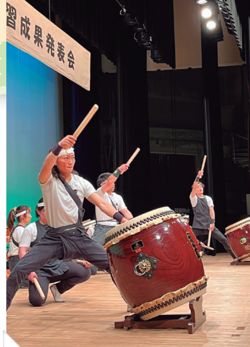
活動団体の発表の場の創出