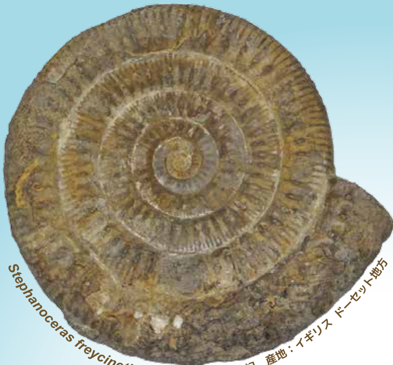
Stephanoceras freycineti 年代：中生代ジュラ紀 産地：イギリス ドーセット地方

古代の海に出現してから 3億年以上もの期間にわたり繁栄した アンモナイトたち。 彼らは一体どのように繁栄し、 そして絶滅したのか、 謎に満ちた歴史をご紹介します。