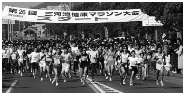
市で運営している三河湾健康マラソン大会