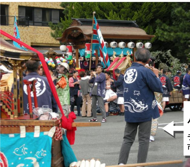
やおとみじんじゃ 八百富神社 チャラボコ チャラボコをやる地区は 市内西部に多いです

蒲郡市内の神社では、この時期に、各地区で色々な秋のお祭りが行われました。 チャラボコ太鼓や笛などでおはやしをしたり、神さまのいる前でおどりや花火を奉納したり します。それぞれのお祭りは、ずっとやり方を変えずに長年受け継がれるものもありますが、 後から新しいものが加えられたりもしていて、同じ名前の曲でも節回しが少し違ったりする ことがあります。